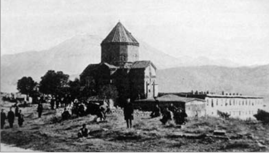
814. Akhtamar Adası ve manastırı, Van(NuK).

İÖ 9. yüzyılda başkenti Tuşpa/Thosbia/Biainili (bugünkü Van) olan Urartu Krallığı'na eklenen geniş Vasburagan eyaleti –çağdaş dönemdeki vilayetin kuzeyinin üçte ikisini kap-