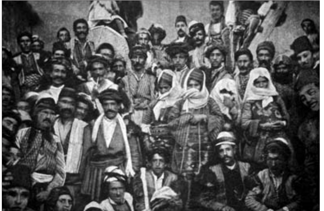
819. Şadakh/Çatak ve Kiavaşlı [Gevaş] hacı-lar, Akhtamar (Araks 1898, s. 70).