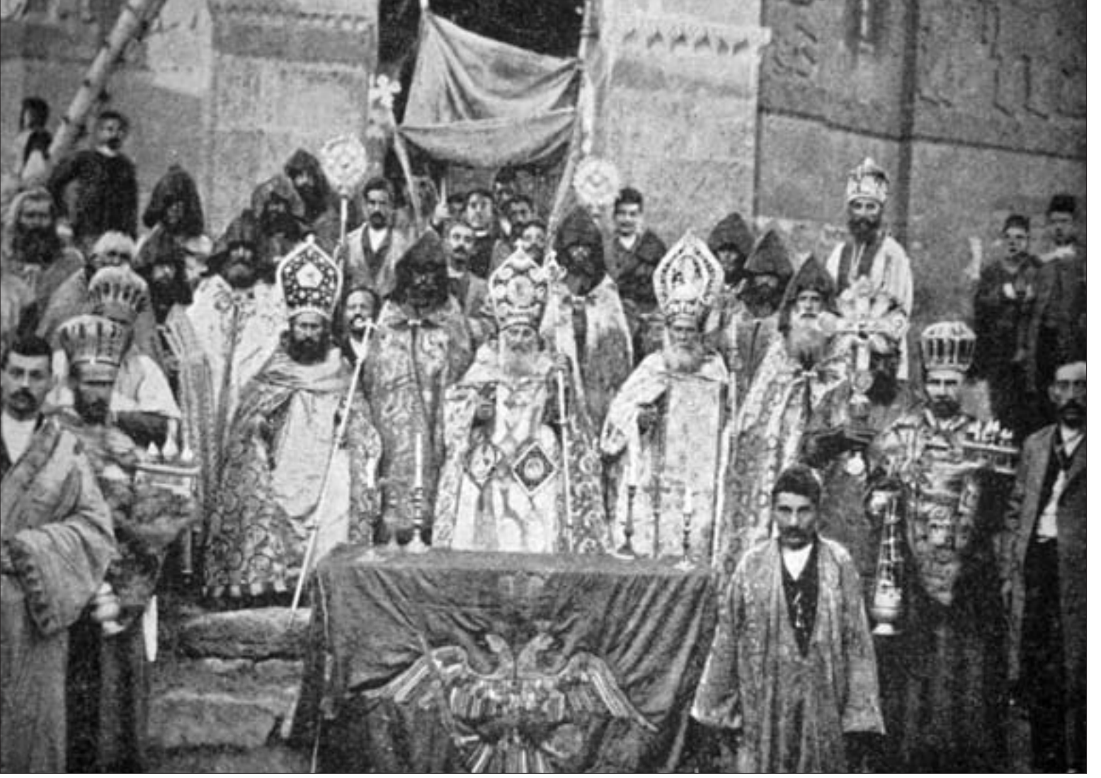
821. Haçverats töreni, Akhtamar (Araks, 1894-1895, f. 2, s. 56).

lan aforoz kararının 1459'daki iptaline dek katolikos sayılmadılar. İki yıl sonra Zakarya Katolikos, vilayetin tam kalbinde çatışan İran Şahı Cihan ile Khlat [Ahlat] Sultanı Cihangir arasında arabuluculuk görevini üstlenerek, Şah'ın ordularının geri çekilmesini sağladı. Bu arabuluculuğun sağladığı elverişli ortamdan yararlanan Zakarya, Vasburagan'da kalmış Ardzıruni prenslik sülalesinin bir kolundan gelen kuzeni Sımpad Sefedinyan'ı, Hıristiyan devletinin yeniden yapılandırılması umuduyla Ermenistan kralı olarak takdis etti. Ancak bu girişimden