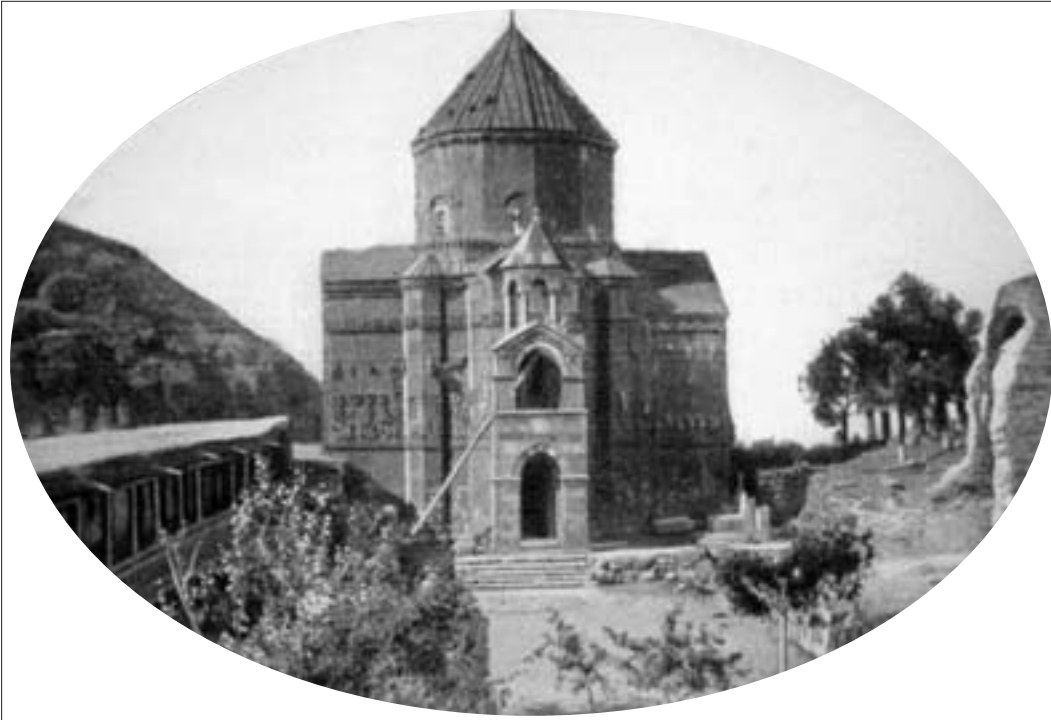
815. Surp Haç Kilisesi, Akhtamar (Dolens, age., 1906, s. 504).