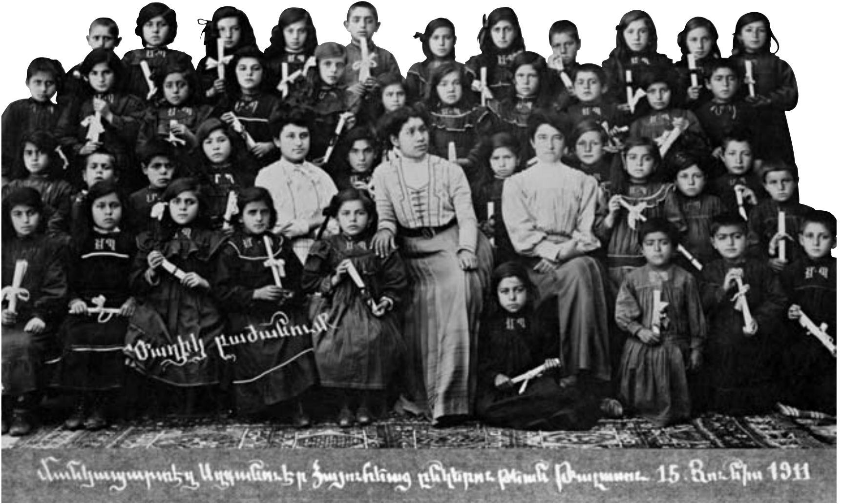
Azkanver Hayuhyats [Milletperver Ermeni Kadınlar] Cemiyeti Talas Anaokulu, 15 Haziran 1911