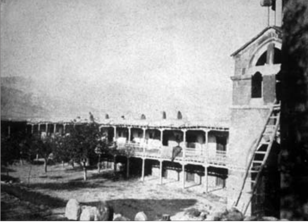
816. Manastırın avlusunun çevresindeki, manastır mensubu olmayanlara kapalı olan bölüm, Akhtamar (Rohrbach, age., no 47).

Vasburagan'ın birinci kazasına tekabül eden Vosdan, Hayots-Tzor, Van-Dosb ve Arcag nahiyeleriyle birlikte Rışduni prenslerinin elindeydi. Doğuda, Yeniçağ'da Osmanlı ve İran imparatorlukları arasındaki sınır boyunca uzanan bölgelerde, Arcag/Erçek Gölü'nün uzantısında yer alan, Palunik sülalesinin denetimindeki Mehnunik Prensliği, bu prensliğin güneyinde ise Büyük ve Küçük Ağpag tımarlarının yanı sıra Martbedagan Beyliği (kabaca, çağdaş dönemdeki Khoşab/Hoşap, Ağpag ve Seray/Mahmudiye kazaları) bulunuyordu; buralar Ardziruni prenslerinin ata mirası yurtlukları olup merkezleri Ağpag, Gankavan ve Hatamagerd'di. Hayots-Tzor ve Dosb arasında sıkışmış olan Yervantunik de feodal bir tımarı. Son olarak, Van Gölü'nün güneyindeyse Vasburagan'ın on birinci kazasını oluşturan son derece önemli iki prenslik, Mok/Moks/Moksene ve Antzevatsik prenslikleri yer almaktaydı.