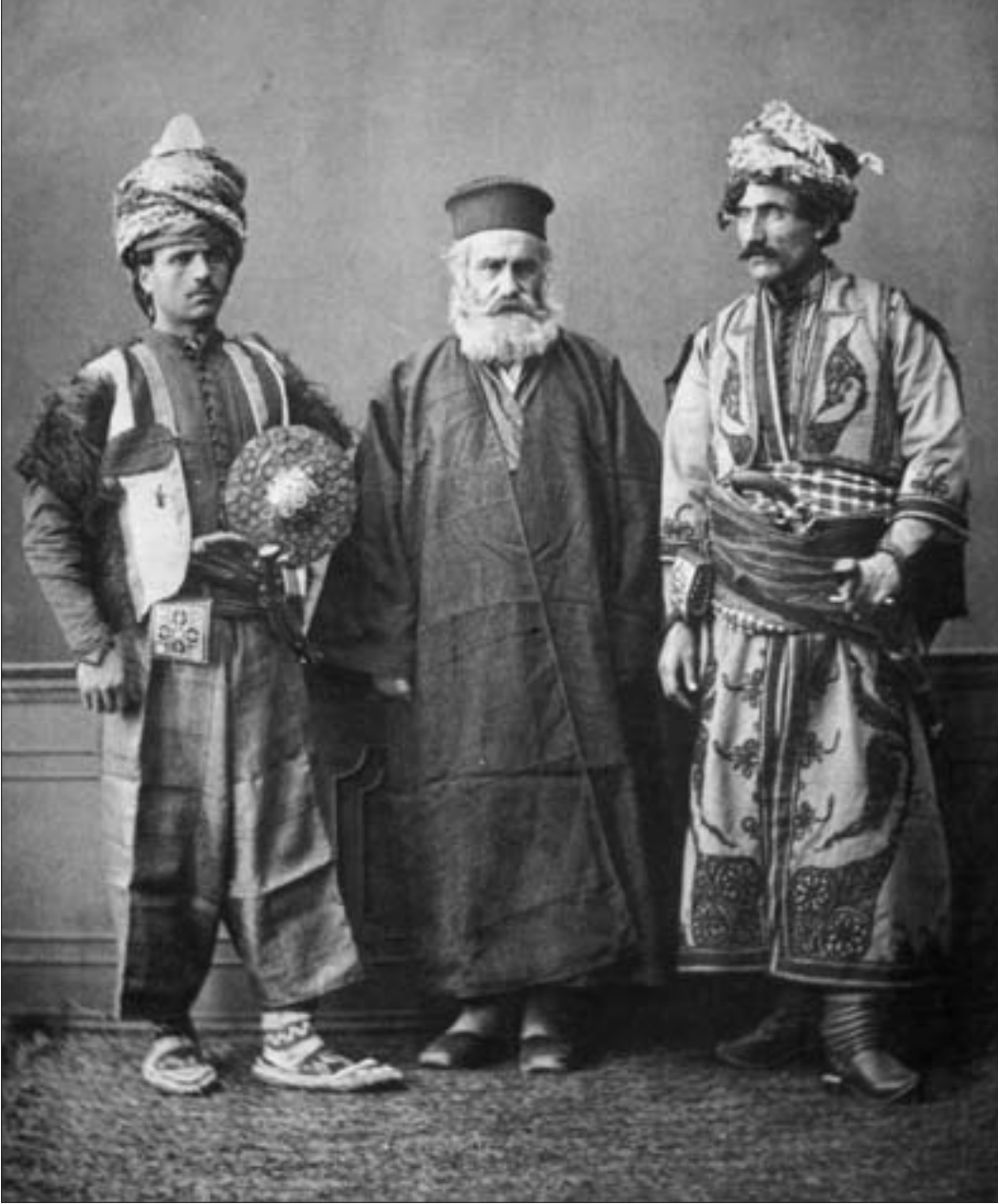
820. Çulamergli Kürt savaşçıları arasında bir papaz, Akhtamar (fototipi, Sebah, 1873, MP kol.).

1914'tekilerle karşılaştırmak gerekir: 110.897 Ermeni (17.802 hane). 3 Tarihi açıdan olduğu kadar coğrafi açıdan da iki apayrı bölge oldukları halde, Hakkâri vilayetinin 1876'da yapay bir şekilde Van vilayetine bağlanması da göz ardı edilmemelidir. Bu bakımdan, Osmanlı yöneticilerinin, Ermenileri yerinden yurdundan etme siyasetine koşut olarak, söz konusu bölgelerin tarihi geçmişine aldırmadan, Ermeni nüfusunu karışık unsurlardan oluşan bir bütünü içinde eritme amacını taşıdıklarını anlamak için, 1914'te Van Sancağı'nda yaşayan toplam 110.897 kişiden 103.432'sinin Ermeni olduğunu belirtmek yeterli olur. Şunu da ekleyelim ki, 79.000 nüfusa sahip Asuri-Keldanilerin de vilayetin nüfus yapısında ağırlıklı bir yeri vardı, özellikle Çulamerg (41.000), Gevar (15.000) ve Ağpag (12.000) kazalarında. 4