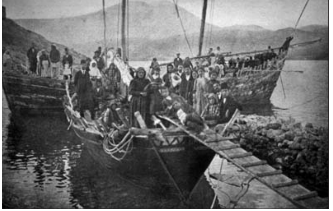
818. Akhtamar'ı ziyarete gelenleri taşıyan teknelerin iskeleye yanaşması (Rohrbach, age., no73).

renklerde kıyafet kuşanma (erkekler için mavi fon üzerine beyaz çizgili başlık) yahut da kadınların sokağa çıktıklarında örtünüp peçe takması zorunlulukları kaldırıldı. Ayrıca bu işbirliği, idari işlerde Ermeniler yer alacak şekilde, merkezin yetkilendirdiği bir valinin atanmasını sağladı. Bunun sonucunda, mağdur olduklarını düşünen Kürt beyleri, reayaya “kendi hakları olan geleneksel vergiyi” dayatmak üzere, aşiretlerini kuzeye yerleşmeye teşvik ettiler. Bu mekanizmanın harekete geçmesi sonucunda, Ermeni unsuru yurdunu boşalttı. Zira İstanbul’un çabucak baltaladığı kısa süren bir Ermeni-Kürt anlaşmasının ardından, özellikle II. Abdülhamid devrinde, İstanbul hızla siyasetini “yeniden dengeledi” ve daha önce küstürdüğü Kürtleri geri kazanarak onları Ermenilere karşı kıskırttı. Böylece, merkezî yönetim, bölgede neredeyse hiç Türk nüfusu bulunmadığı halde, Vasburagan’ı demografik ve ekonomik açıdan korkunç bir durumda bırakmayı ve Ermenilerin demografik atılımını kırmayı başardı. 1