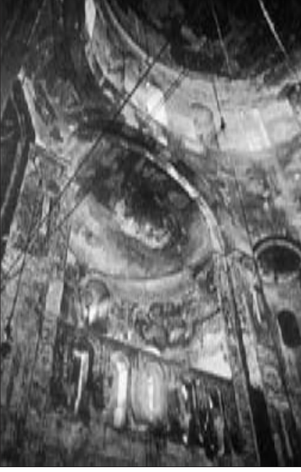
817. Ardzurunilerin kraliyet galerisi ve hayvan yontuları, Akhtamar (Bachmann, age., l. 32), soldaki resim.