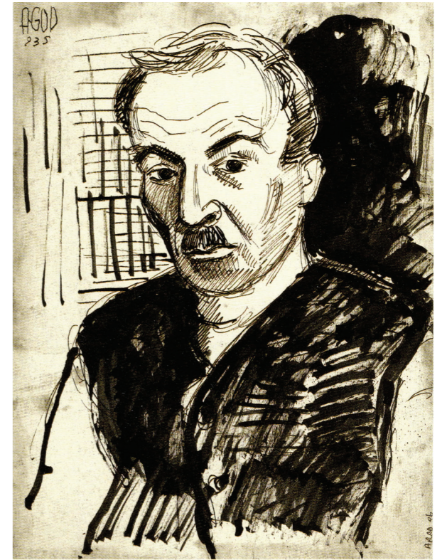
Agop Arad'ın babası (Agop Arad, 28,1x21,4 cm, kâğıt üzerine çini mürekkebi, 1935, Garo Kürkman Koleksiyonu, s. 153.)

O zamanlar gazeteler sabaha doğru basılırdı. Benimle çalışan gazeteci arkadaşların hiçbiri İstanbul'u, Beyoğlu'nu gündüz gözüyle görememişlerdi. Akşam 17'de gazeteye gelir, sabaha karşı çıkardık. Ben Cumhuriyet 'te 25 yıl Burhan Felek'le aynı odada çalıştım. O yüzden ki bu ödülün [Burhan Felek Ödülü] benim için değeri büyüktür. 2